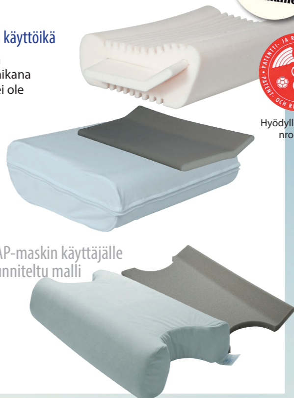
CPAP-maskin käyttäjälle suunniteltu malli